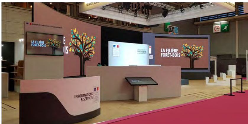
Stand du Ministère de l'Agriculture, salon de l'Agriculture

Création de stand sur mesure, selon vos besoins, nos équipes de créateurs imaginent pour vous des espaces qui vous ressemblent. Dessiner l'espace, révéler des volumes pour mettre en valeur vos message et vos produits. Nos équipes conçoivent, fabriquent en atelier et posent sur vos salons dans un délai imparti en respectant les règlements d'architecture.