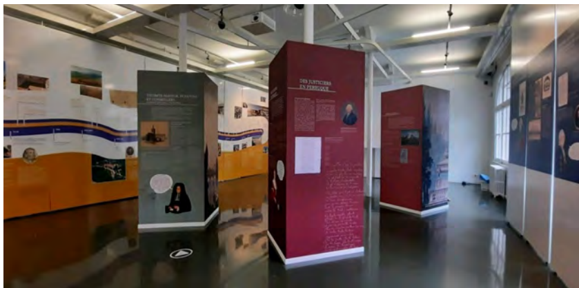
Expo De la Liasse au Pilori, Centre interprétation du patrimoine

Notre service scénographie met en scène, conçoit un parcours en adéquation avec le thème abordé. Création et fabrication de soclage, de mise à distance, de cimaise, mise en couleur, mise en lumière dans le respect des règles de conservation et en dialogue avec les commissaires d'exposition.