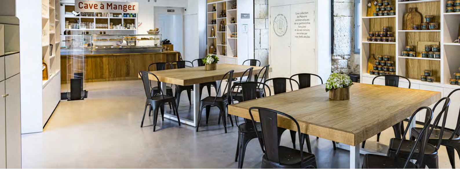
Fabrication et pose d'agencement sur mesure, Cave à manger

Filiale spécialisée dans l'installation générale d'aménagement du bâtiment, IG concept conçoit et réalise vos projets d'installation et d'aménagement.