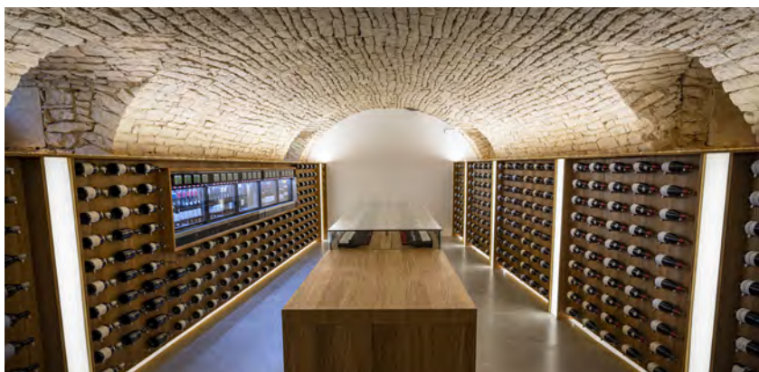
Fabrication et pose d'agencement sur mesure, Cité des vins

Nous fabriquons et posons de l'agencement de qualité, nos menuisiers professionnels travaillent tout type de matière comme le bois, le métal, le verre. Nous trouvons pour vous les solutions de fabrications pour donner vie aux idées des créateurs et dessinateurs.