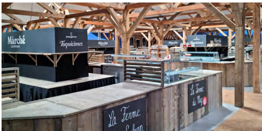
Aménagement et construction des espaces, Toquimes

Nous créons et imaginons pour vous des espaces de caractère, pour personnaliser vos événements. Structures sur mesure pour décors types. Création des espaces, montage de structure fabriquées selon vos idées, sur mesure, décoration, habillage des structures, moquette.