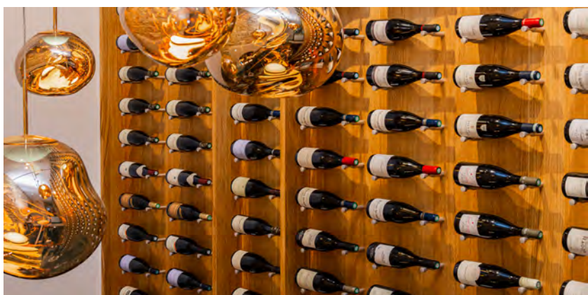
Fabrication et pose d'agencement sur mesure,

Contractant général, nous prenons en charge votre projet, de l'esquisse jusqu'à la finalisation des travaux en vous apportant une réponse globale d'aménagement intérieur, restructuration de l'espace, électricité, plomberie, système de climatisation, agencement mobilier.