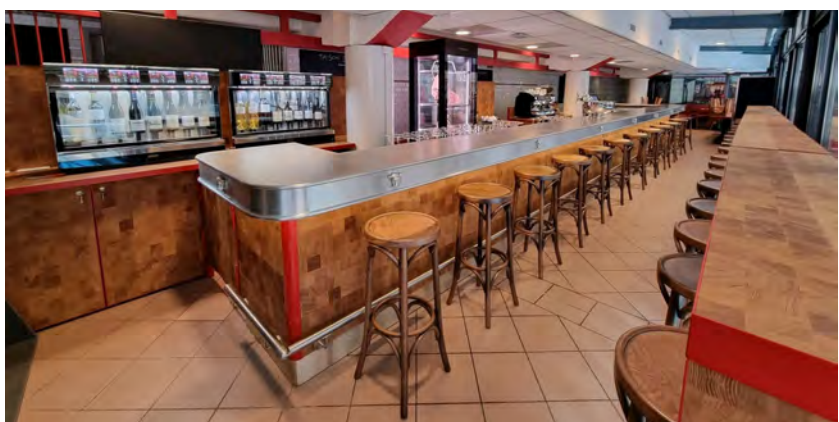
Fabrication et pose d'agencement sur mesure, Maison Louchebem

Le suivi de chantier est le reflet de l'évolution de votre projet. Nos chargés de projet sont à votre disposition tout au long des travaux pour coordonner les interventions et vous rendre compte de l'évolution afin de vous soulager des contraintes techniques.