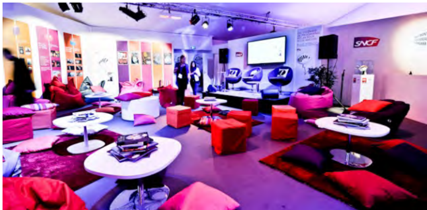
Installation générale et décoration colloque SNCF

Nous nous chargeons de l'installation générale de vos événements et de l'ensemble des installations techniques. Aménagements des espaces stands, des espaces collectifs, commissariat, vestiaires... vélum, distribution électrique, cloisonnement, habillage des cloisons en coton gratté ou tissu imprimés. Prestations sur mesure.