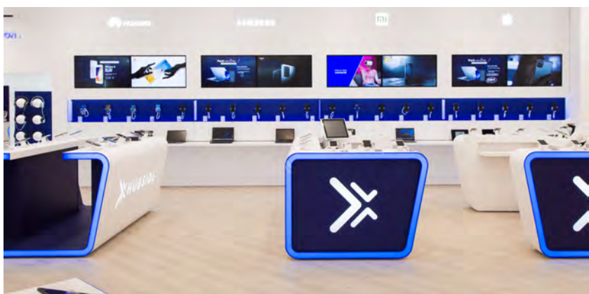
Aménagement sur mesure, Hubsid, Europe

Nous vous soutenons dans votre développement rapide de franchise. Fabrication des comptoirs et éléments et retail en atelier. Pose par notre équipe en boutique en 3 jours en moyenne : montage, installation finition des meubles, éclairage, rangement et enseignes.